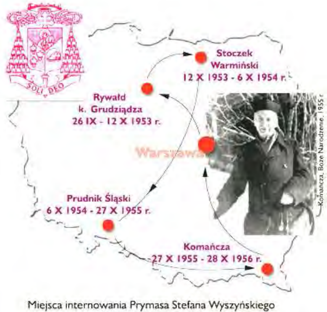
Miejsca internowania Prymasa Stefana Wyszyńskiego

To jest Twoje królowanie nade mną. Uczyniłem co mogłem dla Twojej chwały: przygotowałem w dniu 16 maja tekst Ślubowania, napisałem adorację stanowe: dla kapłanów, dla młodzieży, dla mężów i matek. Te słowa będą mówiły za mnie do ludzi. A ja będę mówić tylko do Ciebie – za nich. Modliłem się o największą chwałę Twoją na dziś. Chciałem ją zdobyć za cenę mojej nieobecności. Ufam, że Królowa Niebios i Polski dozna dziś wielkiej chwały na Jasnej Górze, jestem już w pełni spokojny. Dokonało się dziś wielkie dzieło. Spadł kamień z serca. Oby stał się chlebem dla Narodu” ( Zapiski więzienne ).